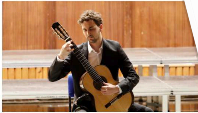
Álvaro Toscano Román, durante su concierto.